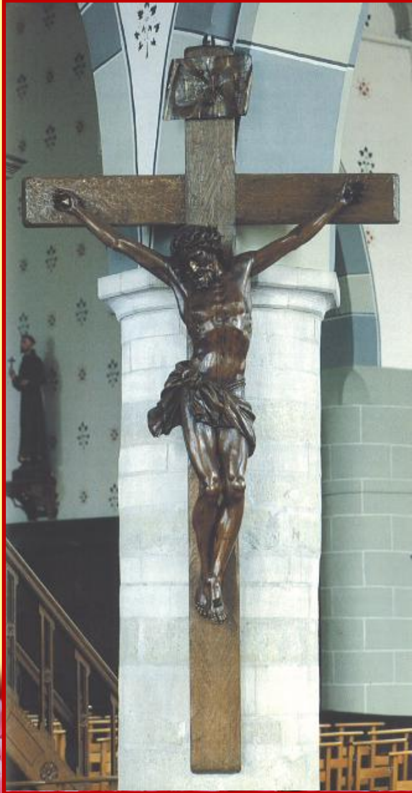
Een Christusbeeld uit lindehout van Quellinus (1650).

Bij het betreden van de kerk langs de middenbeuk trekt een prachtig beeld van Christus aan het kruis, onmiddellijk de aandacht. Het beeld is vervaardigd uit lindenhout en hing jarenlang buiten aan de zuidelijke muur van de kerk. Prominente kunsthistorici duiden Artus Quellinus de Jongere (1625-1700) aan als mogelijke maker van het beeld. Het beeld werd gedateerd rond 1650.